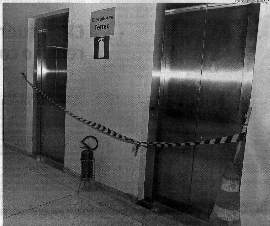
O elevador do Paço ficou interditado ainda no período da manhã e passará por inspeção técnica em breve