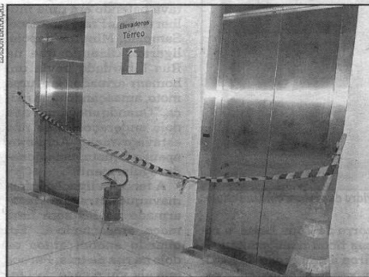
Os acessos ao elevador foram interditados por precaução

gente se cortou bastante porque a luminária caiu". Andressa ainda bateu a cabeça em uma das paredes do equipamento, antes de ser resgatada por um guarda municipal que fazia a vigilância do prédio.